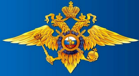
МИНИСТЕРСТВО ВНУТРЕННИХ ДЕЛ РОССИЙСКОЙ ФЕДЕРАЦИИ